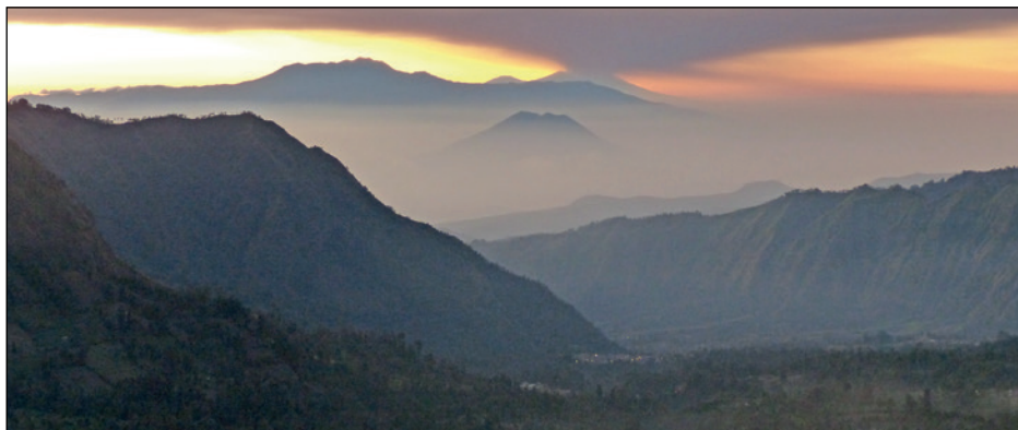
Tírdhreacha áille i gcodarsnacht leis an tsraoilleáil uirbeach

royong don chur chuige nua-liobrálach ó thaobh na heacnamaíochta de, ach is é an cur chuige céanna a chuir le fás eacnamaíoch na hIndinése – cuireann sé ina theannta sin leis an gcineál caimiléireachta a thruaillíonn polaitíocht agus gnó, agus dochar á dhéanamh dá réir sin ar an gcomhshaol go minic. Iadsan atá ceaptha an ceartas a chur chun cinn agus aicmí laga na sochaí a chosaint, is minic a theipeann ar fad orthu. Is é a bhíonn mar thoradh air seo ar fad ná go bhfuil go leor daoine bochta sa tír seo atá saibhir ó thaobh acmhainní de. Go deimhin, tá seanfhocal traidisiúnta san Indinéis a deir linn “go gcaillfí an luch istigh i mbothán lán ríse”. Is é an cineál caidrimh a fhásann idir an saibhreas agus grúpaí eitneacha nó reiligiúnacha ar leith a chuireann le teannas a bheith ann chomh maith. Mar thoradh air seo, tá fás tagtha ar an gcineál raidicithe a chuireann pobal amháin in iomaíocht le pobal eile, agus is in olcas atá a leithéid ag dul leis an mí-úsáid a bhaintear as na meáin shóisialta chun drochbhuachaill a dhéanamh de phobail ar leith.