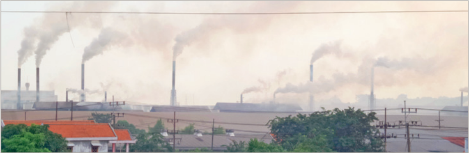
Aerthruailliú ar imeall Surabaya