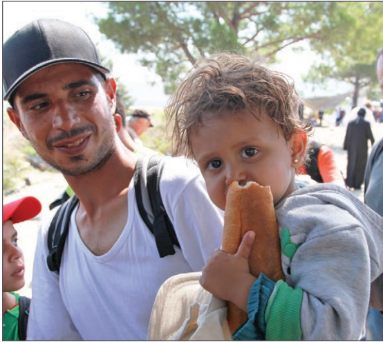
Senior UK Church leaders and representatives investigated the refugee problem first hand at Idomeni on the Greek-Macedonia border