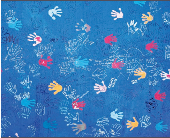
Berlin Wall art