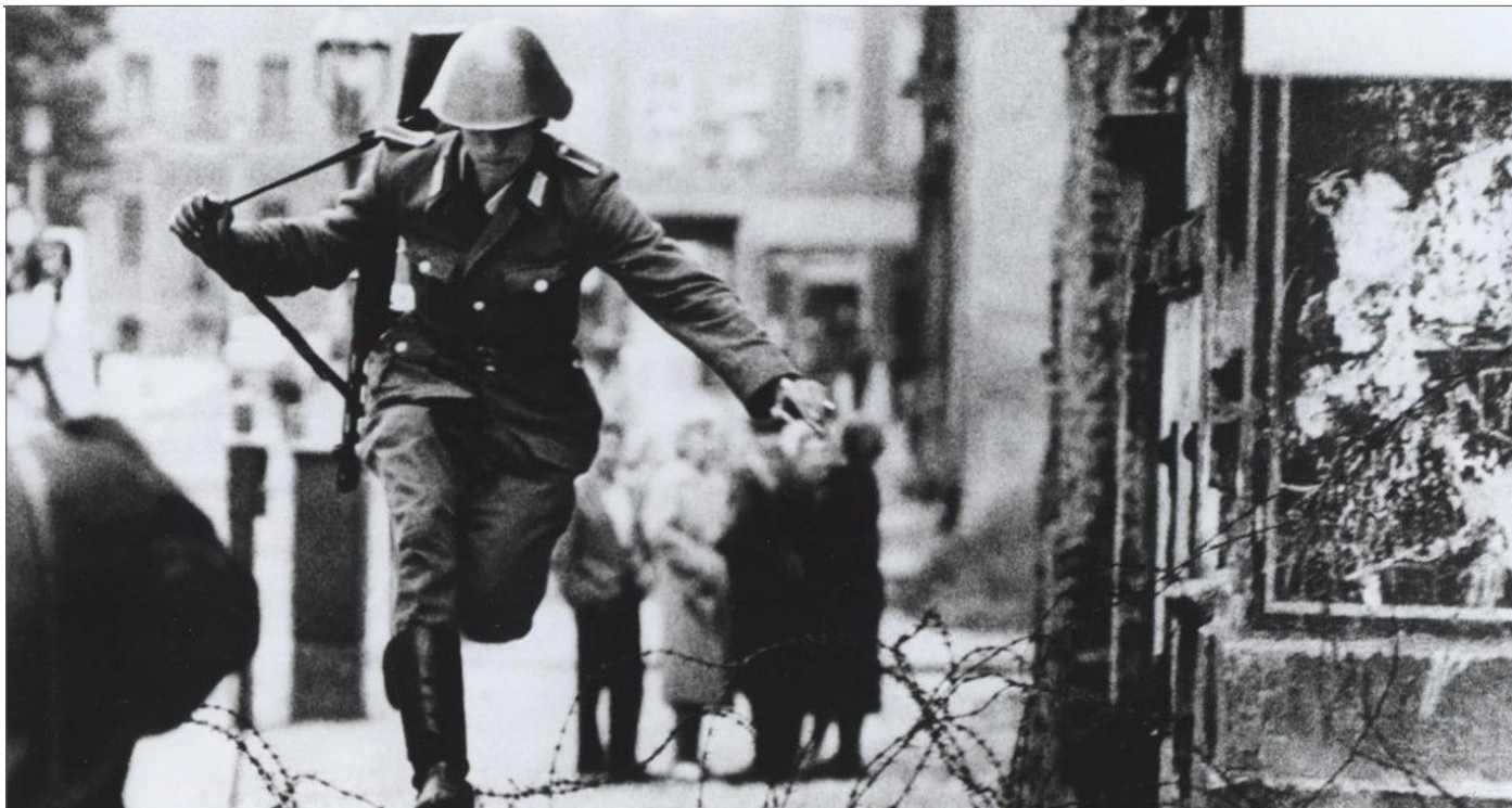
Un o geidwaid ffin ddwyreiniol yr Almaen yn gwrthgilio / An East German border guard defects