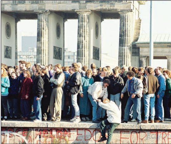
Brandenburg Gate during the fall of the Berlin Wall