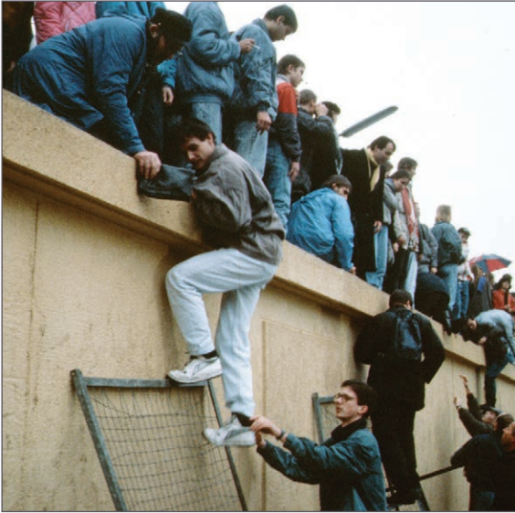
Cwmp Mur Berlin