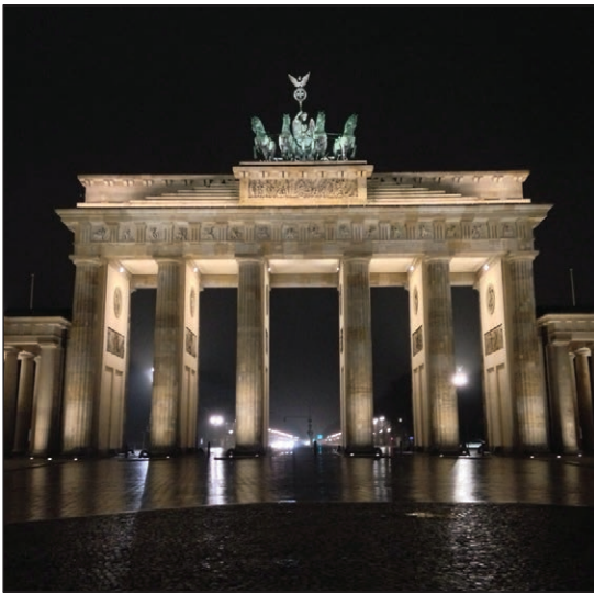
Brandenburg Gate today