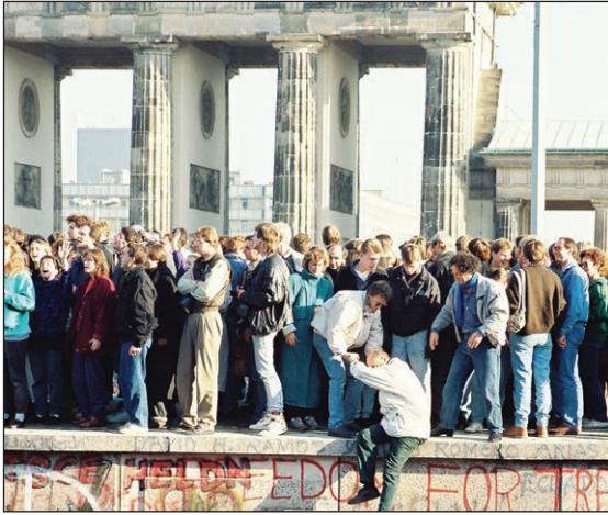
Porth Brandenburg adeg cwmp Mur Berlin