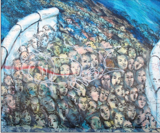
Berlin Wall art