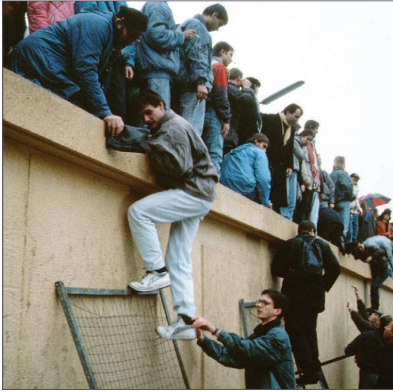
Fall of the Berlin Wall