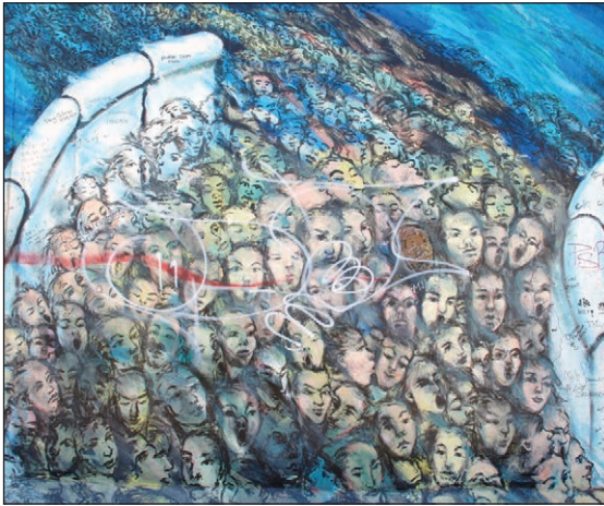
Celf Mur Berlin