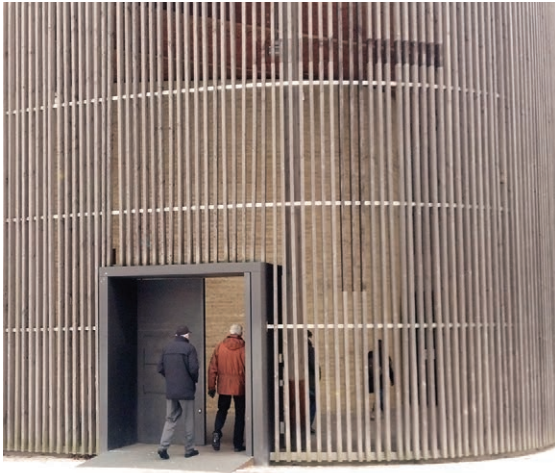
Capel Cymod, Berlin