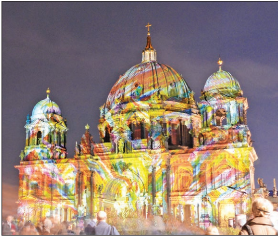
Berlin Cathedral during Festival of Light